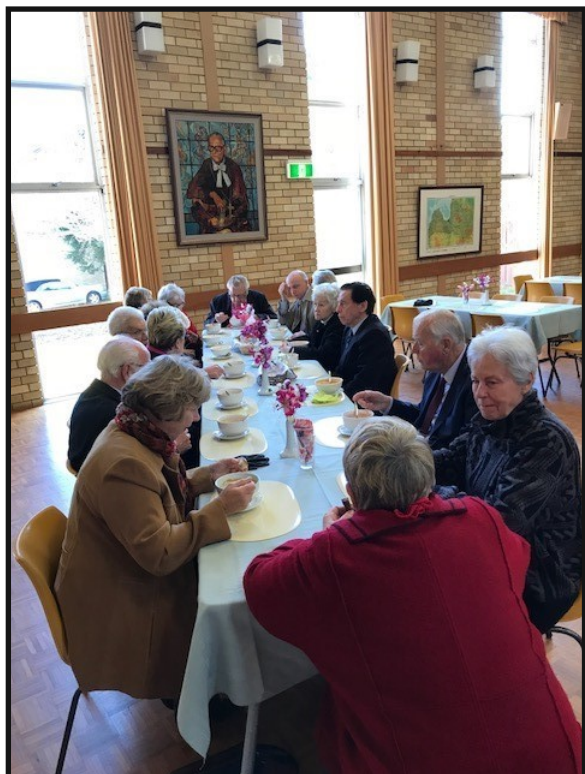
Silta zupa pēc dievkalpojuma.