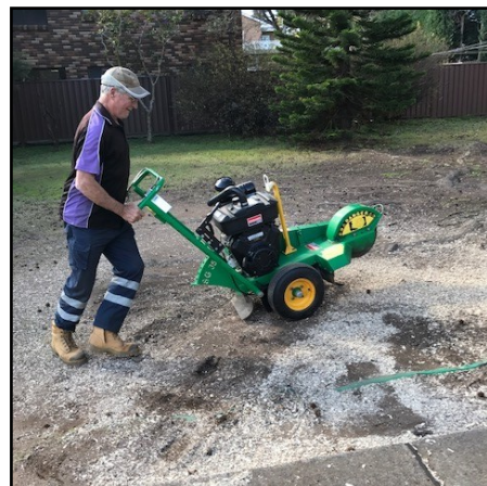
Dārznieks Malcoms apgriež koka saknes.